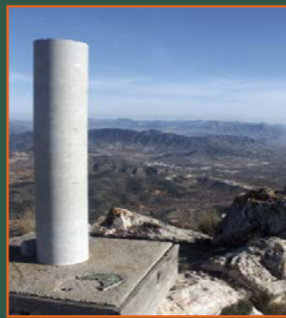
La Romana desde la Peña la Mina