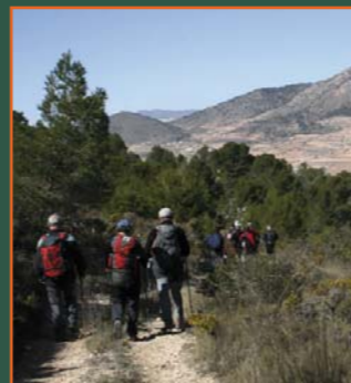
Montañeros en el camino de Algayat