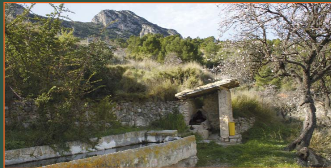
Font del Cucarró