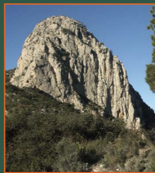
Peña la Mina desde el collado