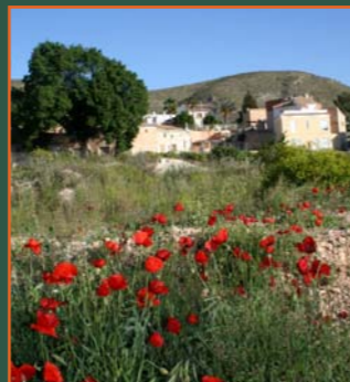
Barrio de San Antón (Les Coves)